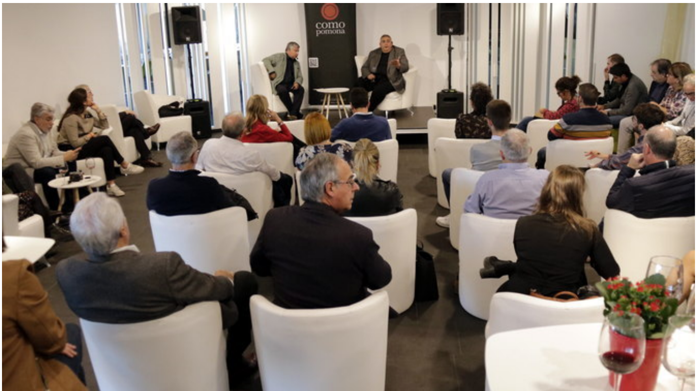
Pla obert d'un maridatge amb tertúlia en el marc de la Festa del Vi de Lleida, el 26 d'octubre de 2019. (Horitzontal)

ACN Lleida.-La plaça de la Llotja de Lleida acull aquest cap de setmana l'11a edició de la Festa del Vi amb l'objectiu de promocionar els cellers de la Denominació d'Origen (DO) Costers del Segre i la gastronomia local, així com fomentar la cultura del vi a la ciutat. Hi participen un total de 17 cellers i 7 empreses i, durant els dos dies, els